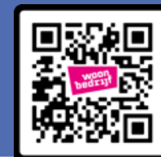
Maak hier je account aan

Om de nieuwe website als huurder te gebruiken, maak je (opnieuw) een account aan. Dit is eenmalig en doe je op www.woonbedrijf.com/regelen/login-aanvragen . Daarna kun je in je 'Mijn Woonbedrijf'-omgeving veel zaken regelen. Je kunt je gegevens bekijken en je contactgegevens aanpassen. Ook kun je een melding doorgeven. Je kunt bijvoorbeeld een reparatie of woningaanpassing aanvragen, overlast doorgeven, een klacht of compliment doorgeven of je mening delen over je woonomgeving. Ook kun je hier online je huur betalen. Alles online en op het moment dat het jou uitkomt. Zo regel je je woonzaken sneller én houd je overzicht.